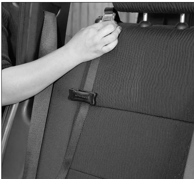
2. Das Ende mit der Verschlusschnalle oben über den Sitz legen.