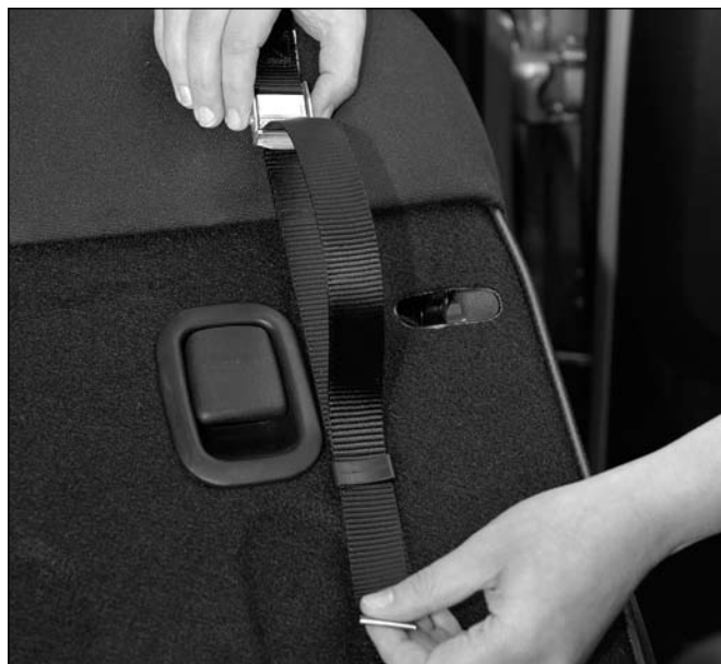
5. Das lose Gurtende durch die Lasche führen.

Die Gurthöhenverstellung ist jetzt einsatzbereit. Die Bedienungsanleitung finden Sie umseitig.