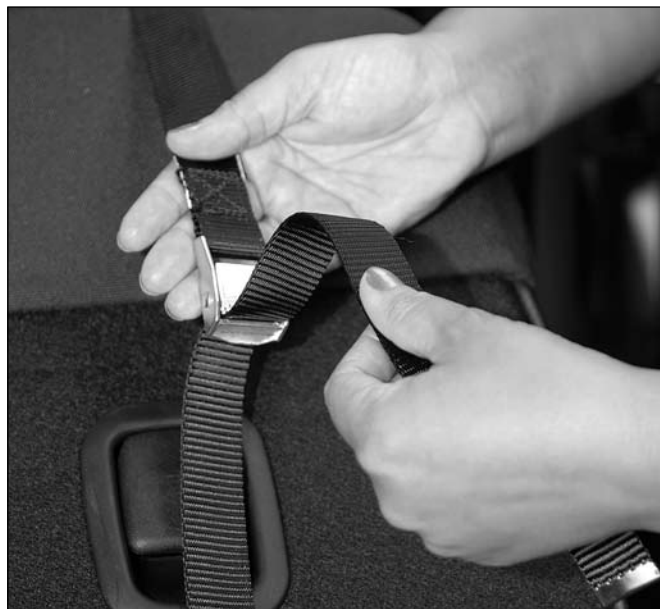
3. Den Hebel der Verschlusschnalle drücken und den unteren Teil des Gurtes durch die Öffnung führen.